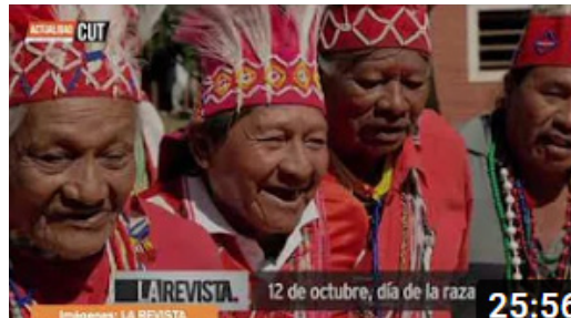
Emisión del sábado 23 de octubre de 2021