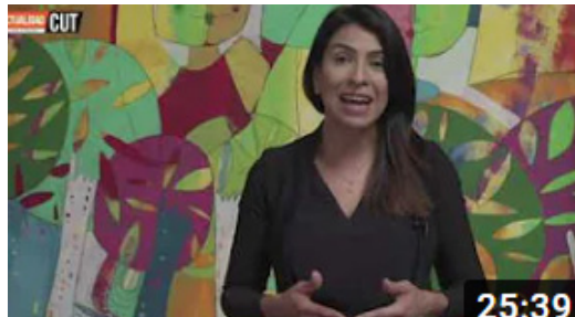
Emisión del sábado 16 de octubre de 2021