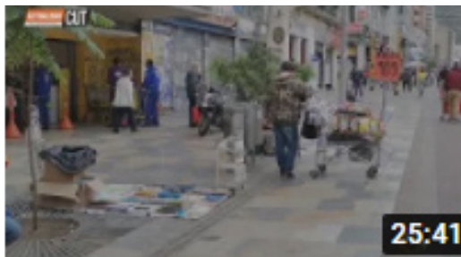
Emisión del sábado 30 de octubre de 2021