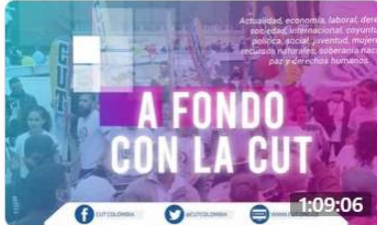
Premio Nobel de Economía de economía desmonta el mito del... hace 4 semanas · 2 mil reproducciones