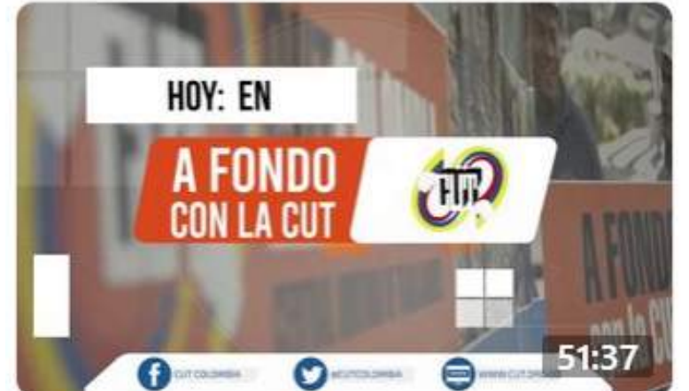
Análisis relaciones Colombia-Venezuela hace 3 semanas · 942 reproducciones