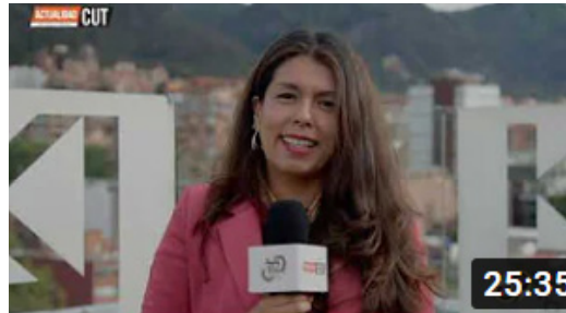
Emisión del sábado 9 de octubre de 2021

Vea el programa de televisión de la CUT nacional