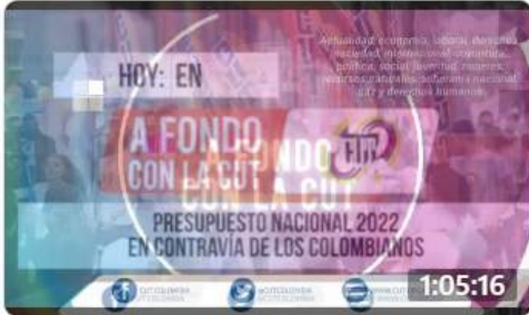
Presupuesto Nacional 2022 en Contravía de los Colombianos hace 5 semanas · 1 mil reproducciones